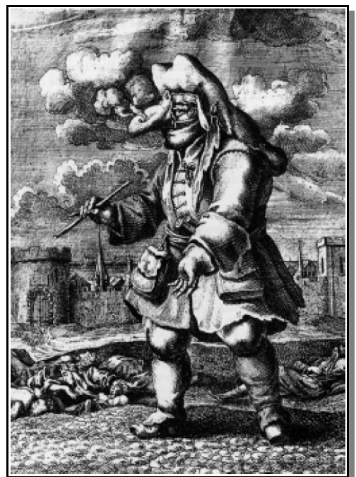
Abb. 2: Doktor mit Schnabelmaske, mit der er sich durch Verbrennen aromatisierter Hölzer, von Rosmarin, Wacholderbeeren, Schwefel oder auch Schießpulver vor der Pest zu schützen suchte.

Besonders bekannt wurden die „Schnabeldoktoren“, die neben einer meist großen Glasbrille eine schnabelartige Maske vor Mund und Nase trugen, die mit den verschiedensten Aromata gefüllt war. Noch im 19. Jahrhundert führten manche Ärzte beim Besuch von Kranken spezielle Stöcke bei sich, deren Knauf einen mit derartigen